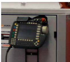
Teachpendant robotkezelő készülékek

ROBOTIKÁT kínálunk – és tesszük ezt a szokásosan magas színvonalú BVS szolgáltatási minőségben , korrekt árakon.