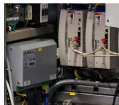
Vezérlések / szervóerősítők & tápegységek