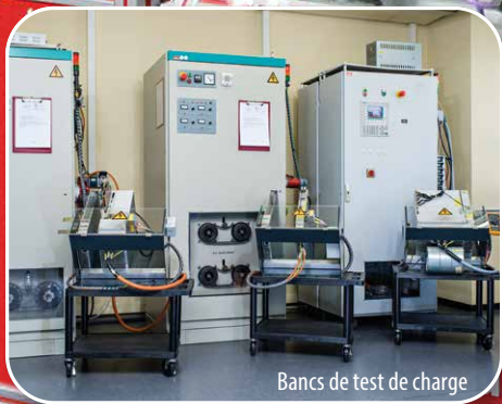
Bancs de test de charge