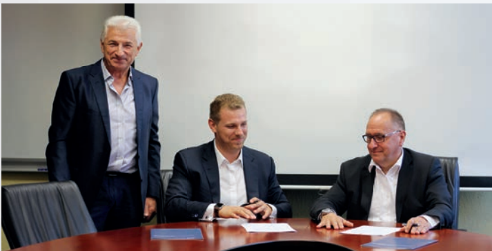
Die Vertragsunterzeichnung zur neuen Kooperationsvereinbarung fand in den Betriebsräumen der BVS Electronics statt.

Seit 2015 tragen wir als einziges Unternehmen weltweit aus der Steuerungs- und Antriebsbranche den Status „ Bosch Rexroth Service Point “.